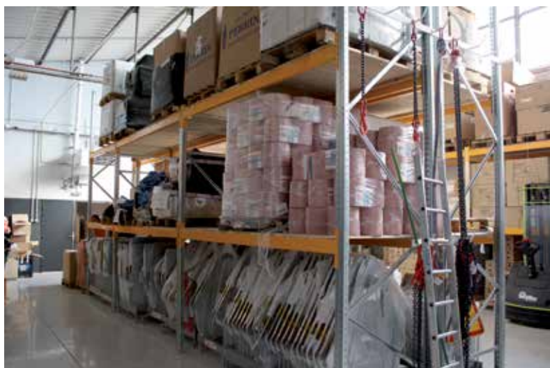
Comptoir de Matériel dispose d'une surface de stockage et de préparation des commandes de 200 m 2 . Il comprend notamment un stock tampon permettant un picking rapide pour le réapprovisionnement des agences sur le 20/80 d'une offre d'articles orientée TP.