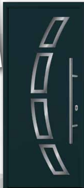
Modèle: Select 010, Motif 457, RAL 7016, Barre de tirage HB38-2

ZI de Gron - 7, rue des Salcys CS 70711 - 89107 SENS Cedex - France Tél. : 03 86 64 85 85 - Fax : 03 86 95 94 14 info@tubauto.fr - www.tubauto.fr