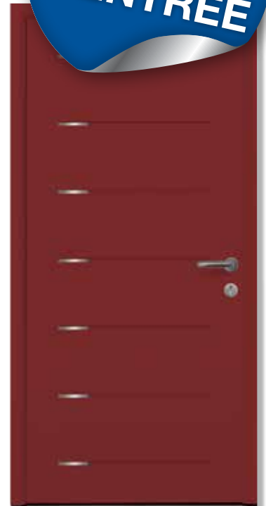
Modèle: Select 015, Motif 401, RAL 3003, Bequille sur rosace ronde