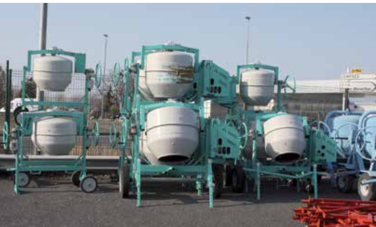
L'espace extérieur permet de stocker des matériels encombrants telles les bétonnières (photo), les brouettes, les étais, etc.

En termes de logistique, les produits sont livrés par les fournisseurs directement à Clermont qui les stocke directement dans son espace de vente pour une majorité d'entre eux, les plus encombrants étant entreposés dans le stock de 200 m 2 . Cet espace, également utilisé pour la préparation des commandes, abrite aussi dans un endroit dédié un stock tampon des références vendues par les agences afin de pouvoir rapidement les réapprovisionner. Ces articles sont livrés aux Comptoir de Location par les