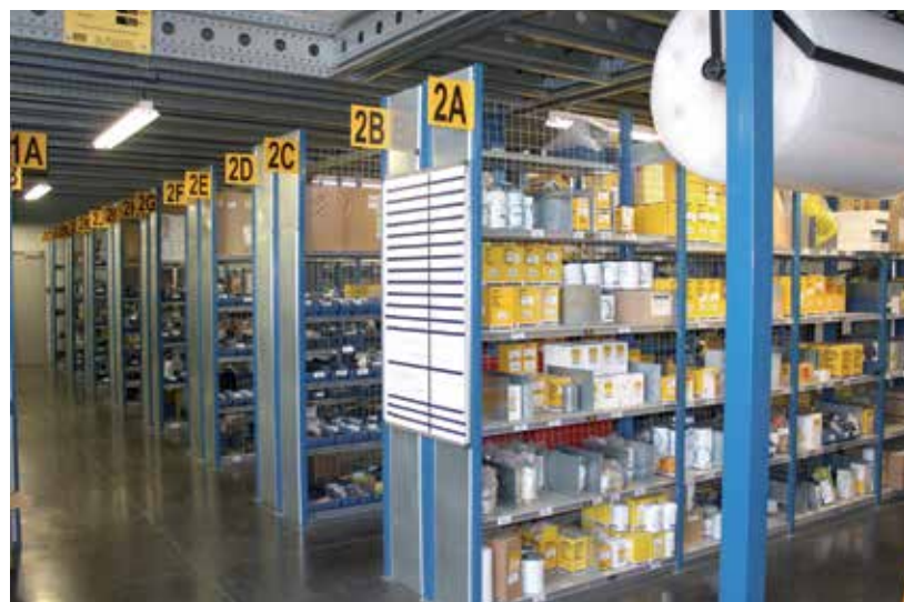
Le négoce possède un atelier de SAV dédiée aux petits matériels et une réserve de pièces détachées globale grands et petits matériels organisée par marques. Avant 2015, les pièces détachées étaient dans le bâtiment abritant le libre-service.