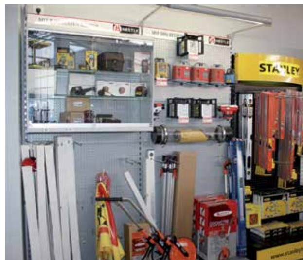
Quelques aperçus des 500 m 2 du magasin Comptoir de Matériel avec une partie des linéaires d'outillages, le rayon dédié à la mesure et l'offre EPI.

paces verts et de couverture. Pour les autres agences qui s'appuient essentiellement sur l'activité location, le référencement est beaucoup plus orienté TP et réduit à l'essentiel, le 20/80, avec un stock limité d'une valeur de 15 000 €